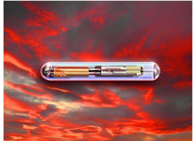
Der RFID-Chip - ein Zeichen und Wegweiser zur Hölle

Weitere Informationen auf der Website http://www.gottes-warnung.de